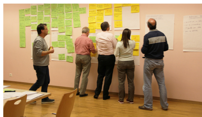
Les groupes de travail en pleine réflexion !

Inscriptions et contact sur : www.les6.ch/contact